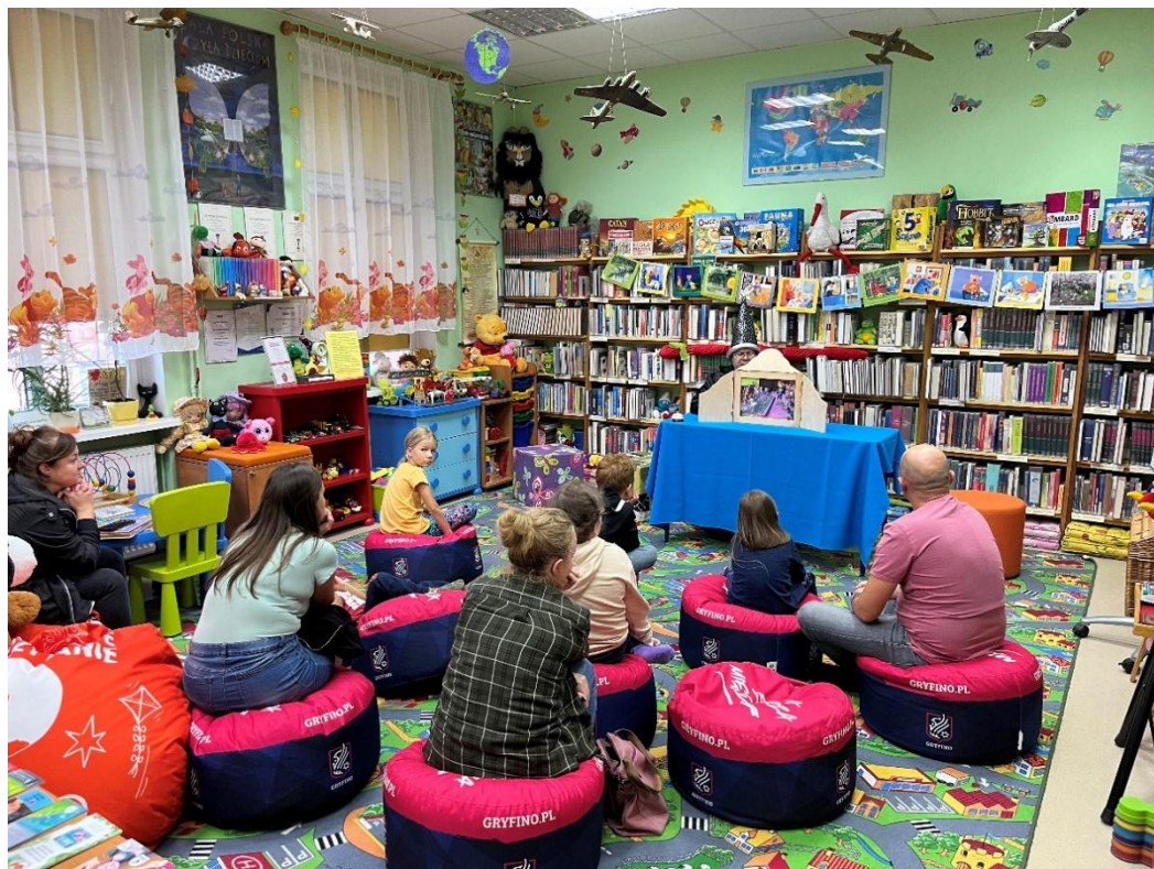
Fot. 8. Noc Bibliotek

projekcja filmu pt.: „Mój brat ściga dinozaury” – wzruszającej i pełnej ciepła opowieści o relacji braterskiej, akceptacji i odkrywaniu różnorodności.