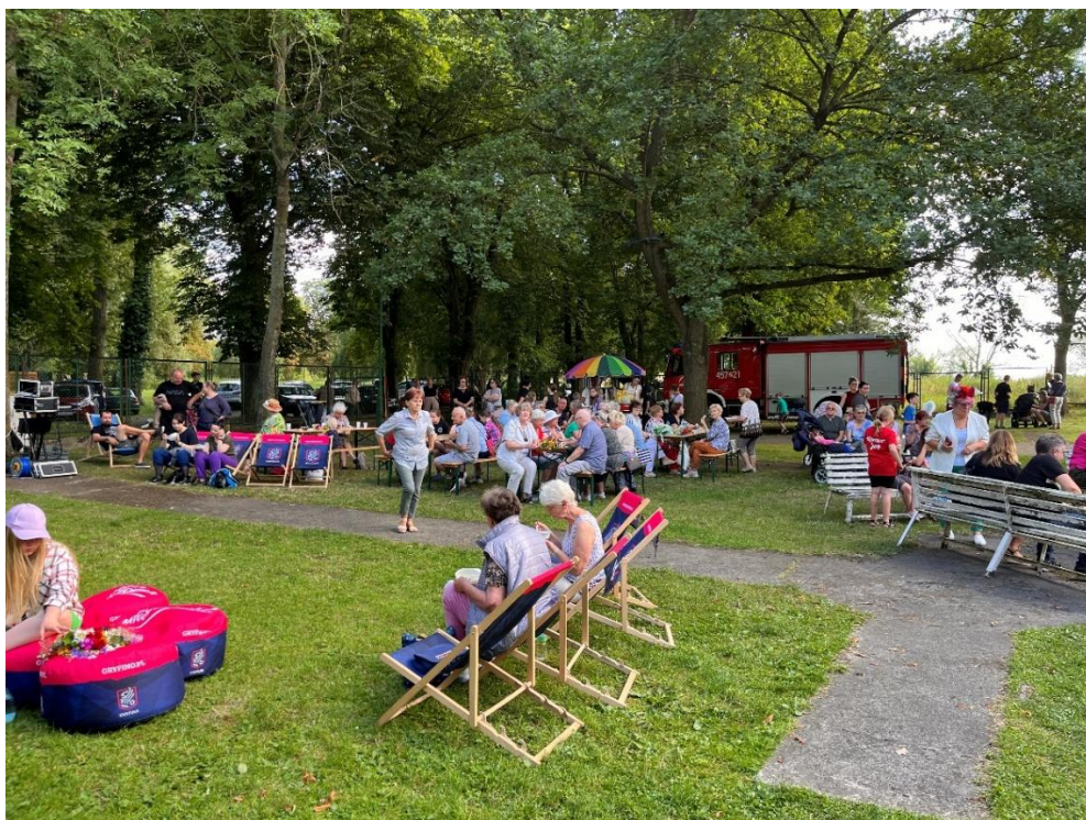
Fot. 5. Gryfińska Noc Świętojańska

Imprezę wspierał, jak co roku, Gryfiński Dom Kultury, zapewniając nagłośnienie imprezy oraz jego obsługę.