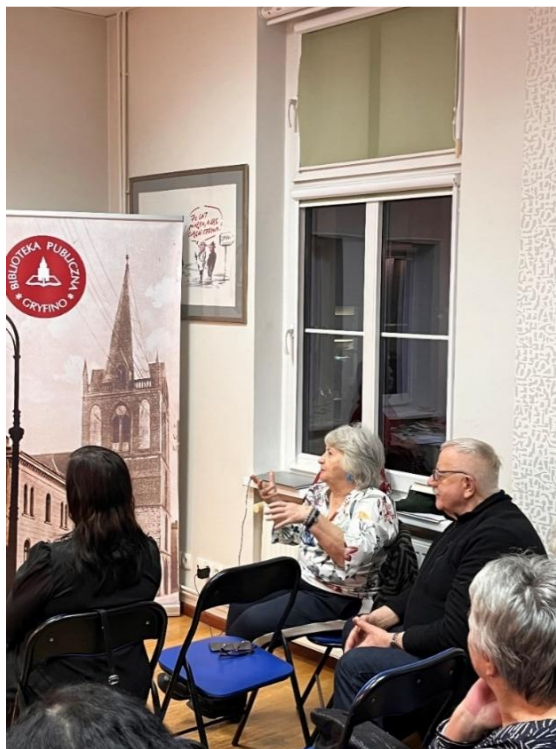
Fot. 11. Jedno ze spotkań Dyskusyjnego Klubu Książki

do rozwijania pasji czytelniczej, budowania więzi międzyludzkich oraz inspirujących dyskusji, które często wykraczają poza literackie ramy i prowadzą do rozważań nad współczesnym światem. Jest to także kolejne działanie prowadzone przez Bibliotekę Publiczną w Gryfinie, aktywizujące tę grupę czytelniczą.