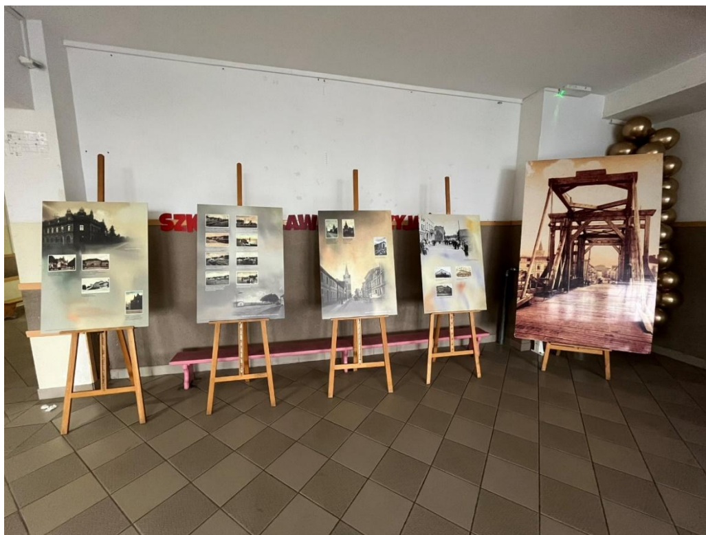
Fot. 2. Wystawa okolicznościowa pt.: „Gryfino – ab urbe condita” przed aulą SP 3 w Gryfinie

Z myślą o podkreśleniu znaczenia tej rocznicy oraz popularyzacji wiedzy na temat dziejów miasta, Biblioteka Publiczna w Gryfinie przygotowała okolicznościową wystawę pt.: „Gryfino – ab urbe condita”, prezentującą kluczowe wydarzenia i procesy historyczne związane z powstaniem oraz rozwojem Gryfina. Ekspozycja prezentowana była podczas uroczystej gali, a później na pl. ks. Barnima I oraz przed gmachem Biblioteki Publicznej w Gryfinie.