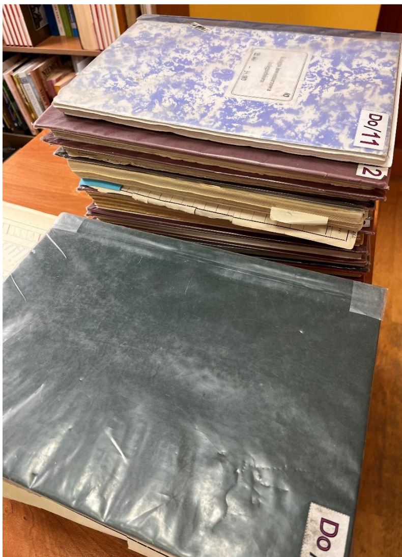
Fot. 14. Praca Działu Gromadzenia i Opracowania Zbiorów