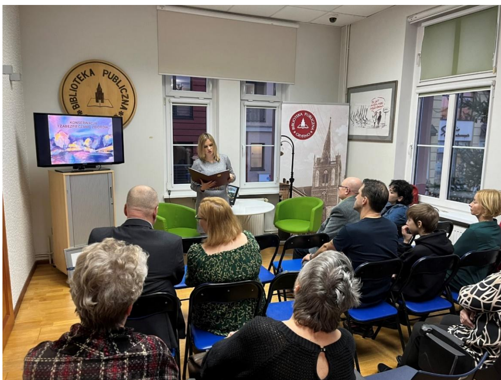
Fot. 1. Pierwsze spotkanie z mieszkańcami w ramach realizowanego projektu

13 września 2024 roku odbyło się spotkanie podsumowujące projekt, podczas którego zaprezentowano zgromadzone zbiory. Efekty przeprowadzonej zbiórki można było obejrzeć w formie dwóch prelekcji połączonych z prezentacjami multimedialnymi, a także w formie wystawy zgromadzonych przedmiotów, towarzyszącej wydarzeniu.