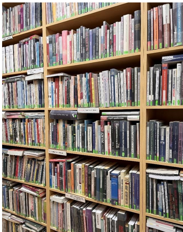
Fot. 15. Księgozbiór Czytelni dla Dorosłych