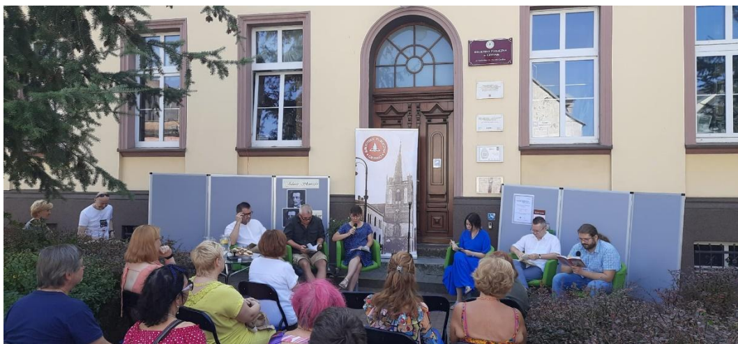
Fot. 7. Narodowe Czytanie

w głębię słów Słowackiego oraz wspólnie przeżywać emocje i refleksje, jakie niesie ze sobą ten ponadczasowy dramat.