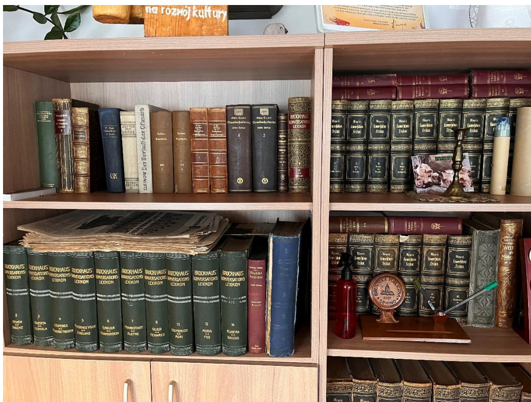
Fot. 13. Część zbiorów znajdujących się w Dziale Zbiorów Specjalnych

Dział Zbiorów Specjalnych Biblioteki Publicznej w Gryfinie realizuje zadania związane z ochroną dziedzictwa kulturowego Gryfina oraz popularyzacją jego historii wśród mieszkańców i odwiedzających.