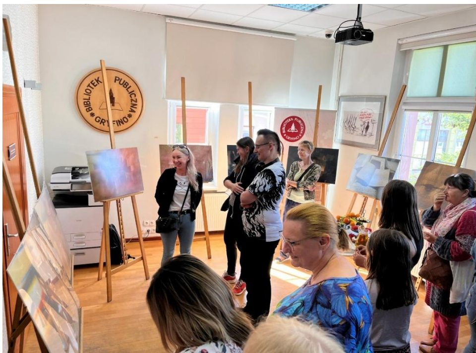
Fot. 4. Wystawa „Geneza Myśli” autorstwa Andrzeja Kaczora

17 maja na pl. ks. Barnima I pracownicy biblioteki rozstawili plenerową wystawę pt.: „Melchior Wańkowicz pod Monte Cassino”, przygotowaną z okazji 80. rocznicy bitwy o Monte Cassino. Ekspozycja poświęcona była postaci wybitnego reportażysty i pisarza, który dokumentował historię tej jednej z najważniejszych bitew II wojny światowej. Wystawa była dostępna dla zwiedzających do 31 maja 2024 roku.