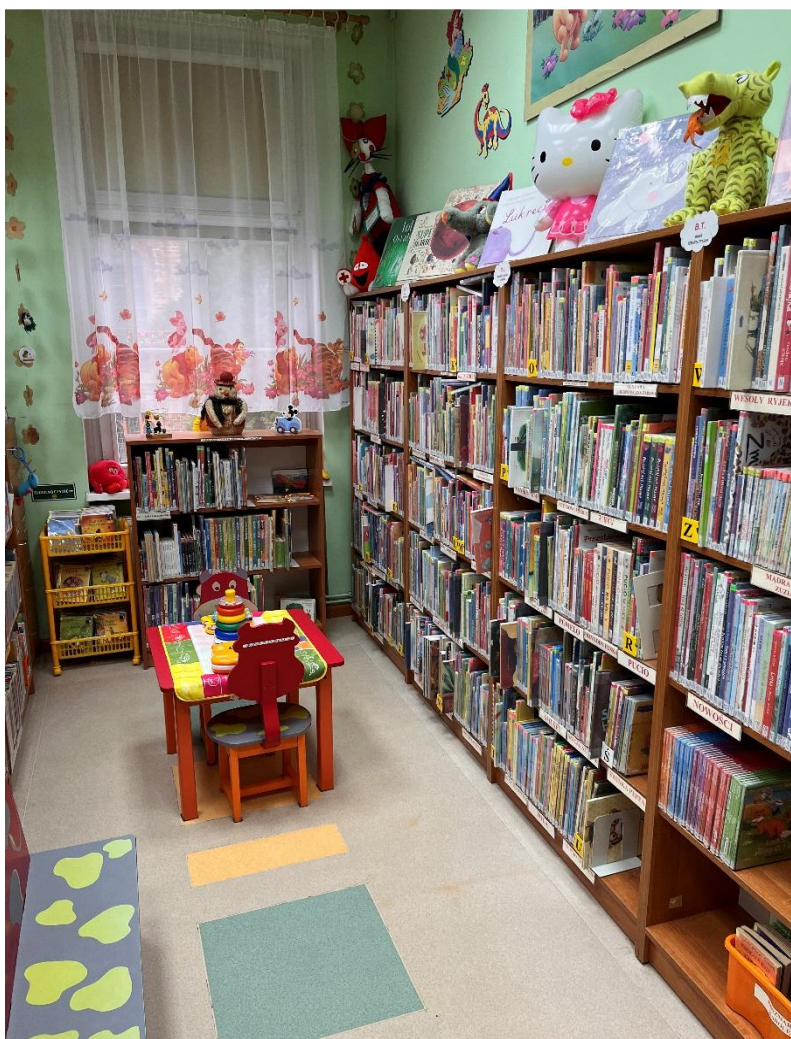
Fot. 12. Oddział dla Dzieci i Młodzieży

ufundowane przez Urząd Miasta i Gminy w Gryfinie, Bank Pekao S. A. oraz wydawnictwa dziecięce. Wyróżniono również rodziców za zaangażowanie w rozwój czytelniczy swoich dzieci.