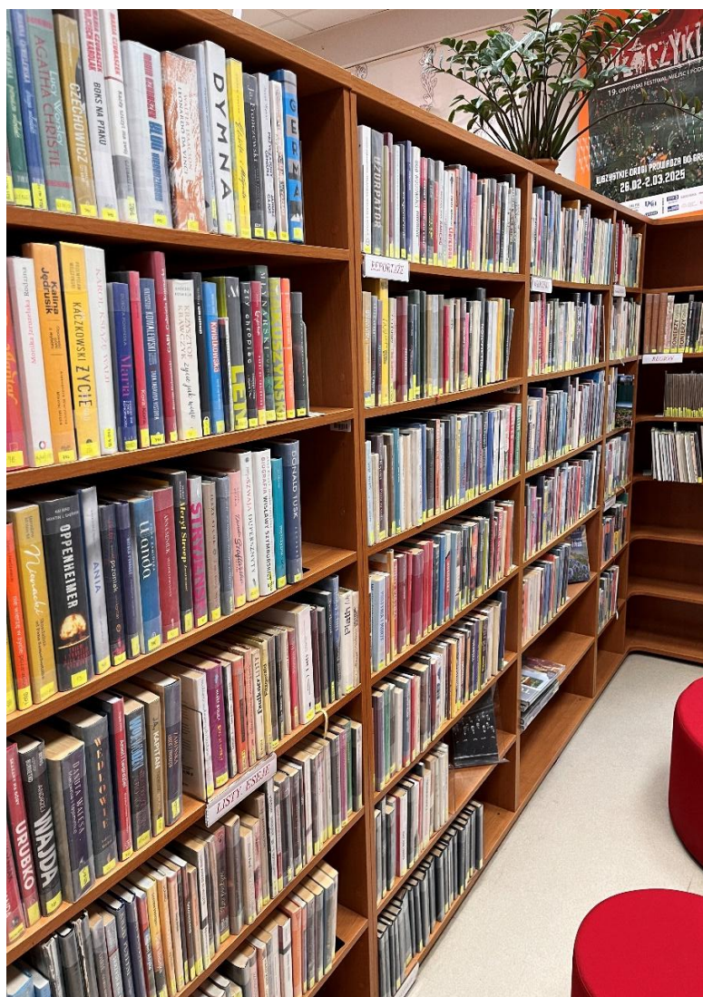
Fot. 16. Księgozbiór Wypożyczalni dla Dorosłych

W celu zapewnienia jak najszerszego dostępu do zasobów, biblioteka systematycznie dokonuje zakupów nowości wydawniczych oraz przyjmuje dary od czytelników i instytucji. Wypożyczalnia prowadzi także politykę selekcji i aktualizacji zbiorów, usuwając z księgozbioru pozycje zniszczone lub nieaktualne.