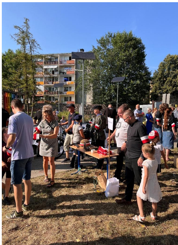
Fot. 6. „Punkt werbunkowy” w którym przekazywano repliki powstańczych opasek

Zaangażowanie Biblioteki Publicznej w Gryfinie w obchodach 80. rocznicy Powstania Warszawskiego stanowiło ważny element lokalnych działań edukacyjnych i patriotycznych, umożliwiającym mieszkańcom Gryfina aktywne uczestnictwo w upamiętnieniu tego historycznego wydarzenia.