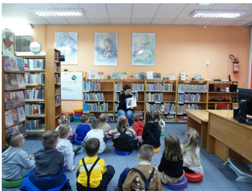
Fot. 18. Spotkanie z książką w Filii Bibliotecznej Górny Taras

Jednym z kluczowych działań filii było organizowanie spotkań z książką, które miały na celu rozwijanie zainteresowań czytelniczych wśród dzieci. W 2024 roku zorganizowano 22 takie spotkania, w których uczestniczyły grupy przedszkolne z gryfińskich placówek. Podczas zajęć bibliotekarki czytały dzieciom bajki i opowiadania, prowadząc rozmowy na temat przeczytanych fragmentów oraz organizując zabawy tematyczne związane z literaturą.