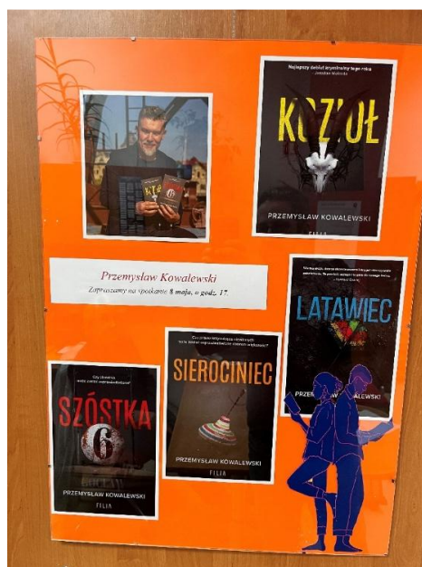
Fot. 17. Plakat promujący spotkanie autorskie

Wypożyczalnia dla Dorosłych aktywnie uczestniczy w promocji czytelnictwa oraz organizacji wydarzeń literackich. Szczególną rolę odgrywa tu popularyzowanie twórczości pisarzy, z którymi biblioteka planuje spotkania autorskie.